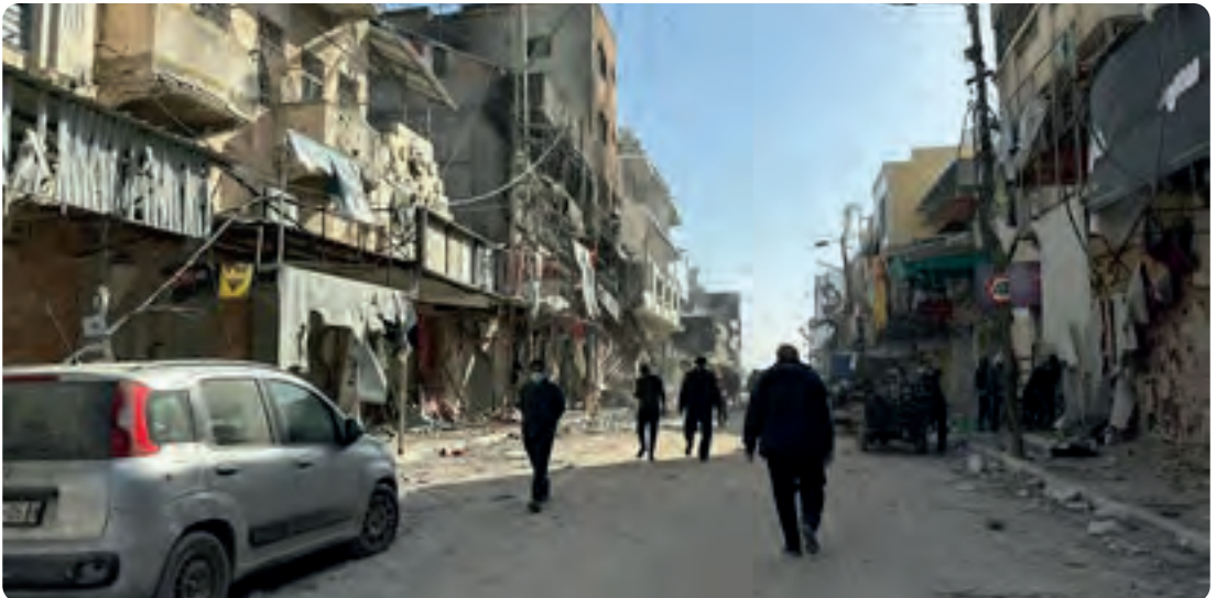
Ein zerstörter Strassenzug in Gaza

Die Lebensmittelversorgung ist sehr, sehr eingeschränkt. „Das Problem hat nichts mit verfügbarem Bargeld zu tun“, erklärt dieselbe Quelle. „Es ist einfach so, dass die Lebensmittel knapp sind und es schwierig ist, sie irgendwo zu finden“. Und: „Die christliche Gemeinschaft ergreift jede Gele-