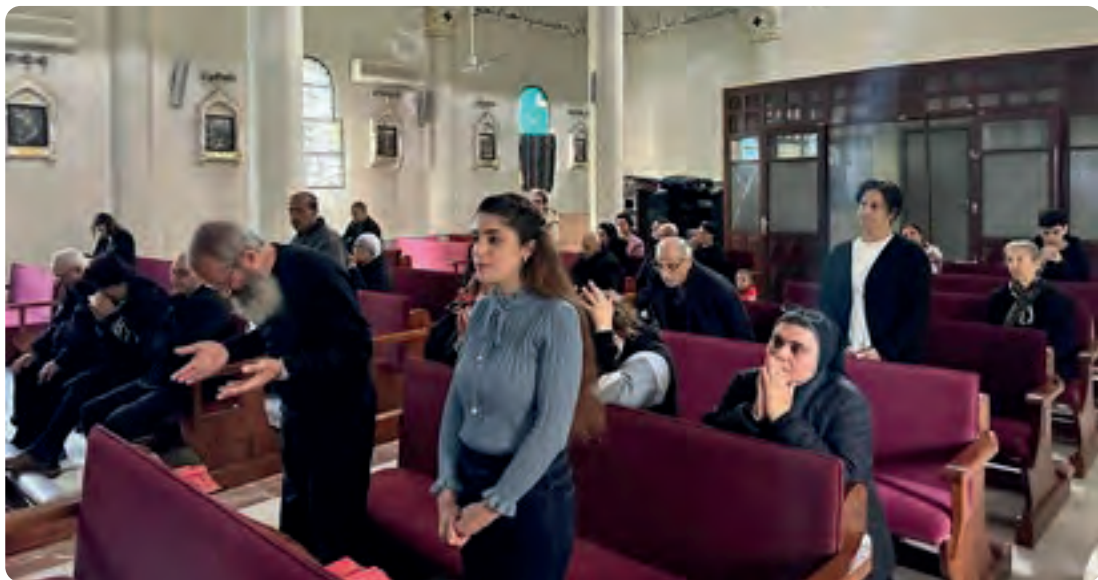
Christen lassen es sich trotz allem nicht nehmen, in der Pfarrkirche regelmässig zur Messe zusammenzukommen