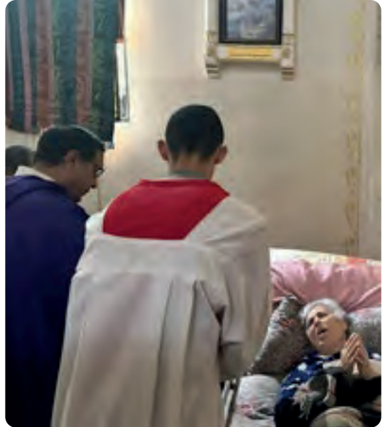
Seelsorge unter prekären Verhältnissen: Eine Frau in Gaza empfängt die Krankenkommunion

Die palästinensischen Autonomiegebiete gehören mit Israel, Zypern und Jordanien zum Lateinischen Patriarchat von Jerusalem. Bischof ist seit Oktober 2020 der Franziskaner Pierbattista Pizzaballa. Papst Franziskus nahm ihn im September 2023 ins Kardinalskollegium auf. Pizzaballas Titelkirche (=Pfarrkirche in Rom, die jeder Kardinal ehrenhalber erhält) ist Sant'Onofrio al Gianicolo. Informationen zum Patriarchat und zur Pfarrei «Holy Family» in Gaza gibt es unter www.lpj.org .